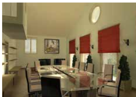
Ristrutturazione e cambio funzione di palazzina presso lo stabilimento SACMI di Imola