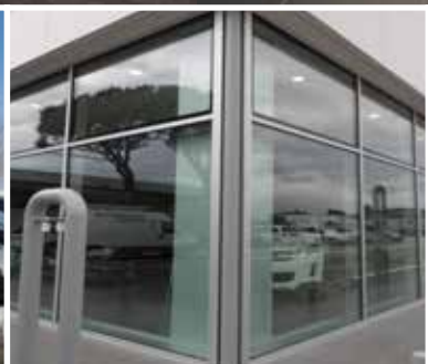
Relooking e miglioramento sismico della concessionaria Citroën di Imola