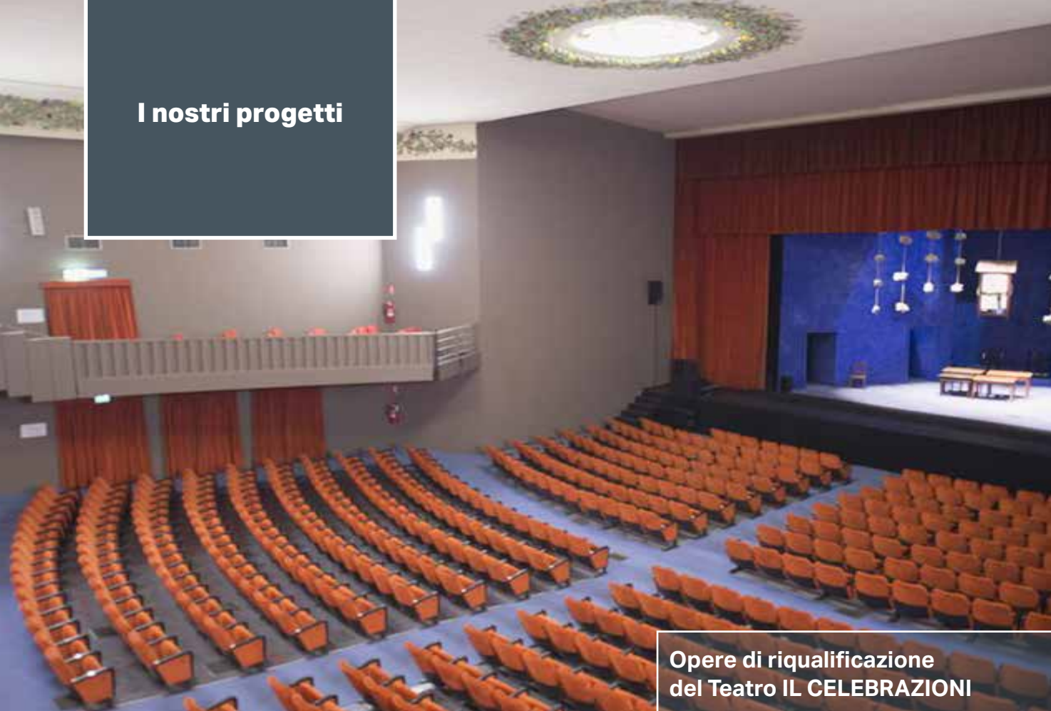
Opere di riqualificazione del Teatro IL CELEBRAZIONI