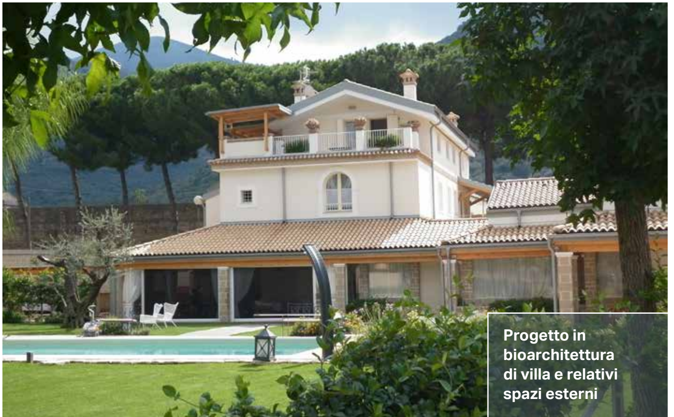
Progetto in bioarchitettura di villa e relativi spazi esterni